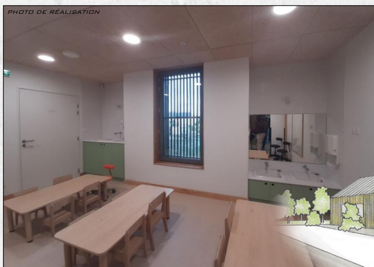
PHOTO DE RÉALISATION