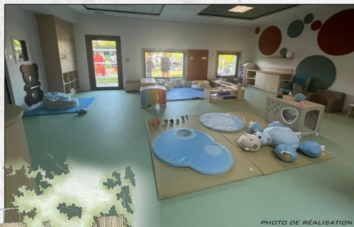
PHOTO DE RÉALISATION