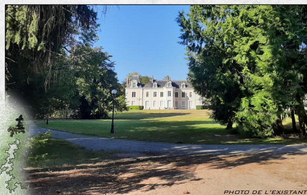
PHOTO DE L'EXISTANT