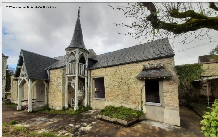
PHOTO DE L'EXISTANT

MONTAGE JURIDIQUE : CONCOURS MOE AVANCEMENT : 2023