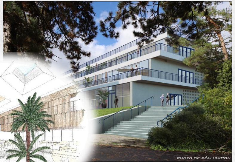
PHOTO DE RÉALISATION