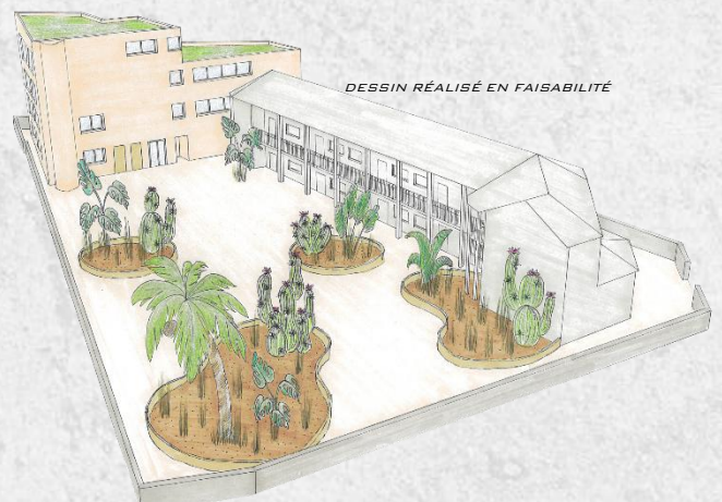
DESSIN RÉALISÉ EN FAISABILITÉ

PROJET D'AMÉNAGEMENT DES LOCAUX DE RESTAURATION DE L'ÉCOLE ÉLÉMENTAIRE DE PASSAMAINTY VILLAGE MONTANT TOTAL DES TRAVAUX : 4,8 M€ HT MAÎTRE D'OUVRAGE : VILLE DE MAMOUDZOU (976) MISSIONS : PROGRAMMATION – ESTIMATION FINANCIÈRE – PLANNING MONTAGE JURIDIQUE : CONCOURS MOE RÉALISATION : EN COURS