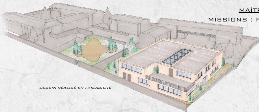
DESSIN RÉALISÉ EN FAISABILITÉ

PROJET DE RÉNOVATION DE LA RESTAURATION DU GROUPE SCOLAIRE DE TSOUNDZOU 2 MONTANT TOTAL DES TRAVAUX : 3,8 M€ HT MAÎTRE D'OUVRAGE : VILLE DE MAMOUDZOU (976) MISSIONS : PROGRAMMATION – ESTIMATION FINANCIÈRE – PLANNING MONTAGE JURIDIQUE : CONCOURS MOE RÉALISATION : EN COURS