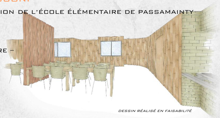
DESSIN RÉALISÉ EN FAISABILITÉ

PROJET D'AMÉNAGEMENT DES LOCAUX DE RESTAURATION DE L'ÉCOLE ÉLÉMENTAIRE DE PASSAMAINTY M'HOGONI MONTANT TOTAL DES TRAVAUX : 528 488 € HT MAÎTRE D'OUVRAGE : VILLE DE MAMOUDZOU (976) MISSIONS : PROGRAMMATION – ESTIMATION FINANCIÈRE – PLANNING MONTAGE JURIDIQUE : CONCOURS MOE RÉALISATION : EN COURS