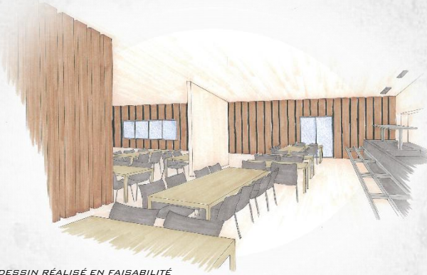
DESSIN RÉALISÉ EN FAISABILITÉ

PROJET D'AMÉNAGEMENT DES LOCAUX DE RESTAURATION DE L'ÉCOLE ÉLÉMENTAIRE DE CAVANI SUD MONTANT TOTAL DES TRAVAUX : 854 849€ HT MAÎTRE D'OUVRAGE : VILLE DE MAMOUDZOU (976) MISSIONS : PROGRAMMATION – ESTIMATION FINANCIÈRE – PLANNING MONTAGE JURIDIQUE : CONCOURS MOE RÉALISATION : EN COURS