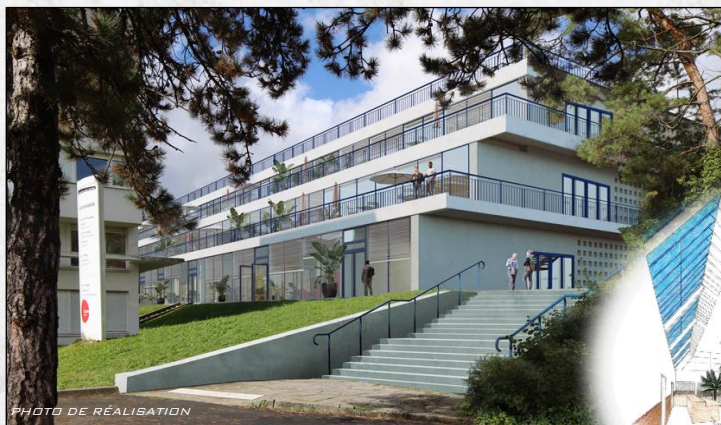
PHOTO DE RÉALISATION