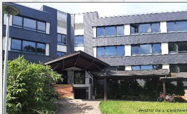
PHOTO DE L'EXISTANT

MAÎTRISE D'OEUVRE : NON RETENUE À CE STADE