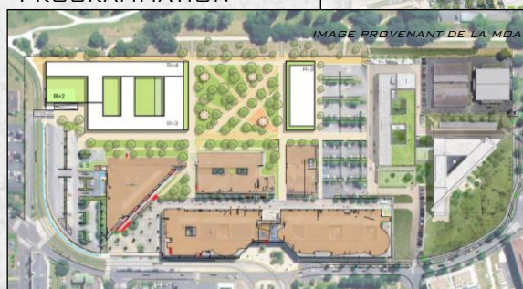
IMAGE PROVENANT DE LA MOA